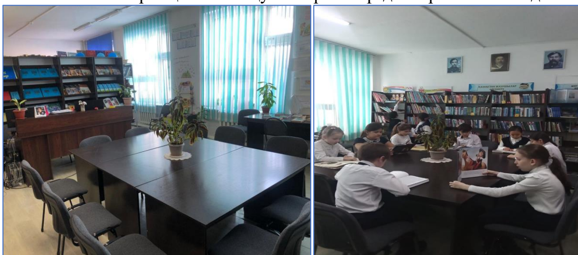
Мектеп кітапханасының негізгі көрсеткіштері

«Халықаралық кітап сыйлау» күніне орай «Кітапханаға кітап сыйлау» акциясы ұйымдастырылды. Мақсаты: мектеп кітапханасы қорын заманауи басылымдармен толықтыру. Мектеп, ата-ана, оқушымен бірлесе отырып, оқушыларды рухани адамгершілікке баулу. Ақын-жазушылардың шығармаларын насихаттау, кітапханаға оқырман тарту, кітап қорын молайту. Мектепте «Оқы және өзгеге ұсын!» тақырыбында «Буккроссинг» кітап алмастыру шарасы үздіксіз ұйымдастырылып отырады. Сонымен қатар мектеп кітапханашылары оқырмандармен бірлесе отырып, көптеген көпшілік іс-шаралар өткіземіз. Ондағы мақсатымыз оқушыларды жан-жақты білім алуға, шығармашылық қабілетін дамыту, жеке тұлғаны қалыптастыруға бағытталған іс-шараларды ұйымдастыру. Одан бөлек «Оқуға құштар мектеп» жобасын іске асыру мақсатында қалалық білім бөлімінде өткізетін сайыстарға қатысып оқушыларым жүлделі орынға ие болды.